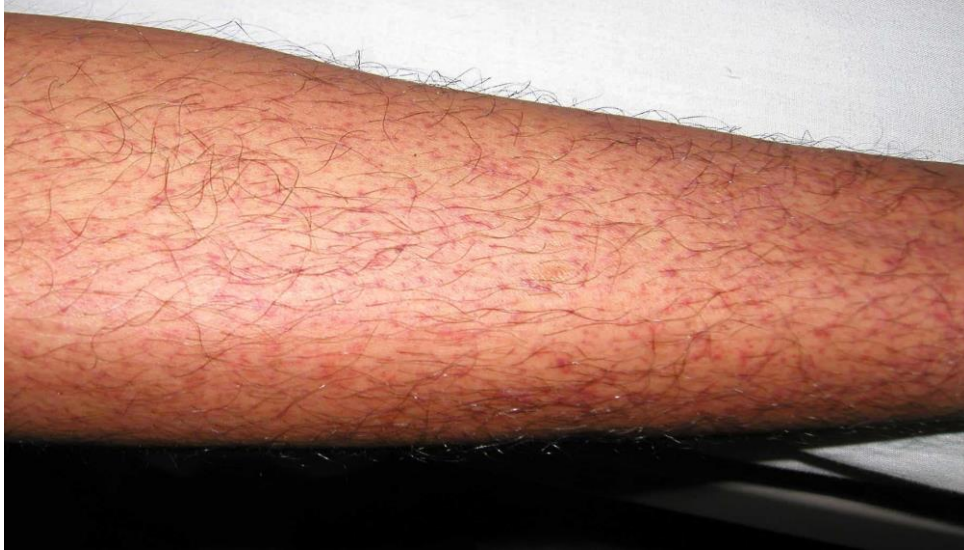
図 1. デング熱患者の発疹：解熱時期にみられた点状出血