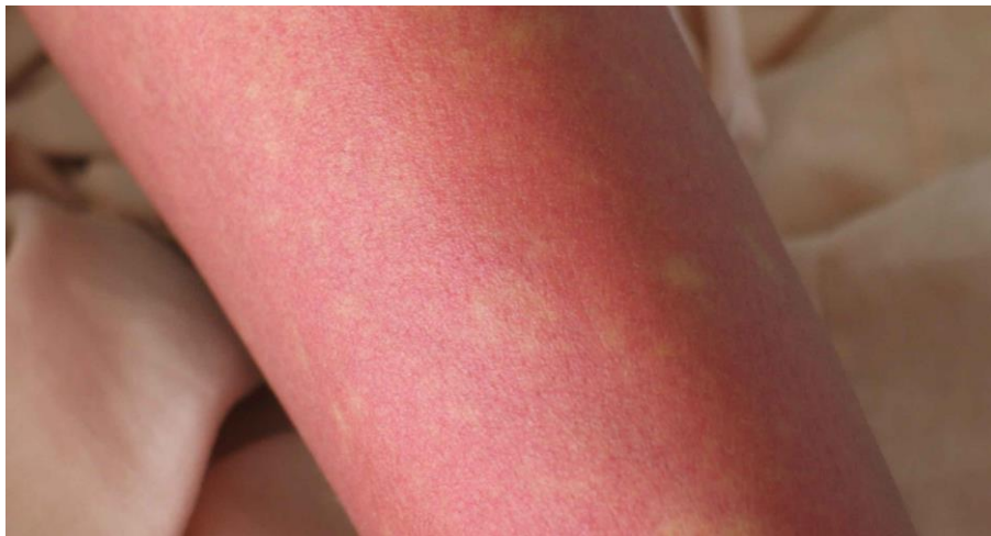
図 2. デング熱患者の発疹：解熱時期にみられた島状に白く抜ける紅斑