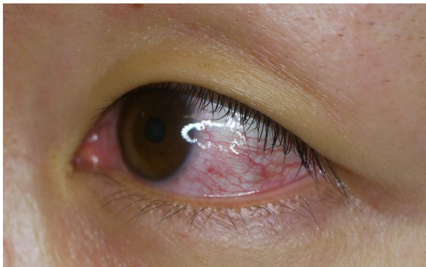
図4. ジカウイルス病の充血性結膜炎