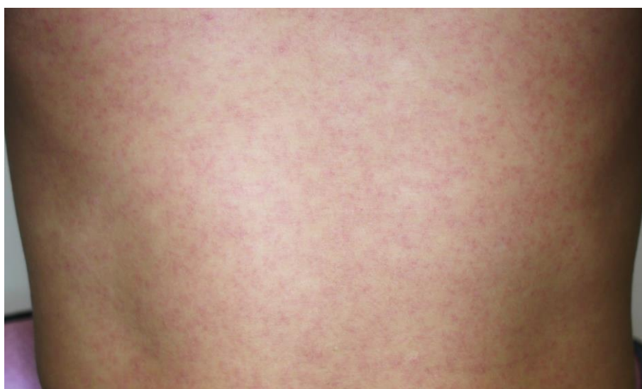
図3. ジカウイルス病の斑状丘疹様の発疹

潜伏期間は、2～12日（多くは2～7日）である。ジカウイルス病の臨床症状は多彩であるが、斑状丘疹様の発疹（ 図3 ）は90～100%に認められるのに対して、発熱の頻度は35～65%とされている 29,47 。また発疹は掻痒感を伴うことが多いとされている。また、大半の症例は入院を必要としなかった。 表7 に2015年のブラジル・リオデジャネイロにおけるジカウイルス病患者が発症後4日以内に認めた臨床症状を示す 47 。